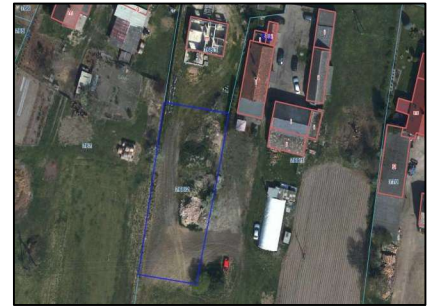
Zdj.3 Ortofotomapa – widok na działkę z góry