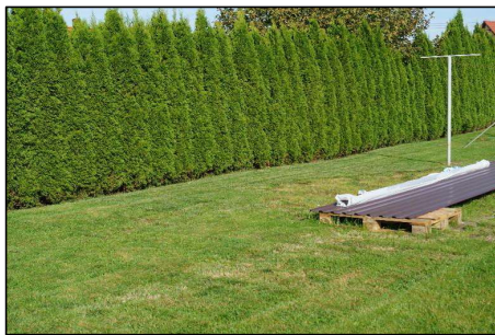
Zdj. 1 Widok na działkę

Przetarg odbędzie się w dniu 16 czerwca 2026 r. o godz. 9 00 w siedzibie Starostwa Powiatowego we Wschowie, Plac Kosynierów 1c, w sali konferencyjnej (III piętro).