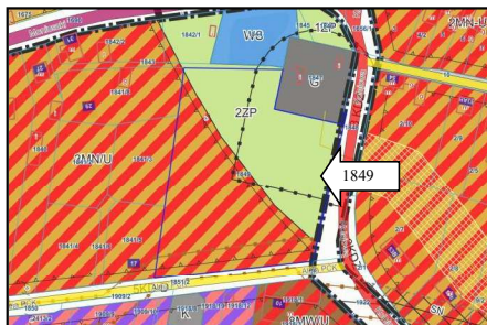
Zdj.2 Wyrzys z Miejscowego Planu Zagospodarowania Przestrzennego