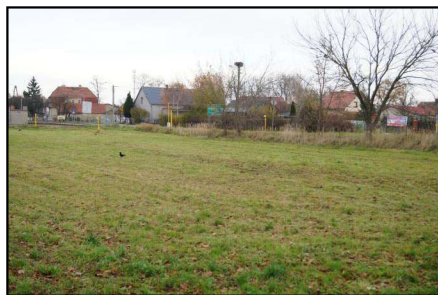
Zdj.1 Widok na działkę 1849 od strony południowej

Przetarg odbędzie się 12 czerwca 2026 r. o godz. 9 00 w siedzibie Starostwa Powiatowego we Wschowie, Plac Kosynierów 1C, w sali konferencyjnej – pok. 319 (III piętro).