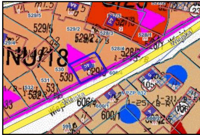
Zdj.2 Wrys z Miejscowego Planu Zagospodarowania Przestrzennego