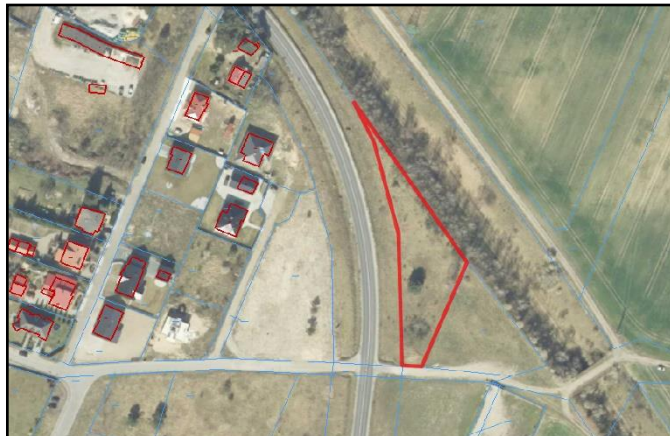
Zdj. 2 Ortofotomapa – widok na działkę z góry