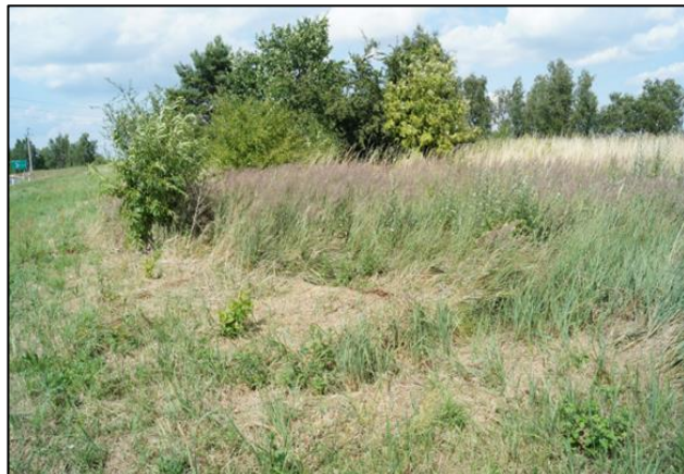
Zdj. 1 Widok na działkę

Przetarg odbędzie się w dniu 28 grudnia 2023 r. o godz. 9 00 w siedzibie Starostwa Powiatowego we Wschowie, Plac Kosynierów 1C, w sali konferencyjnej (piętro III)