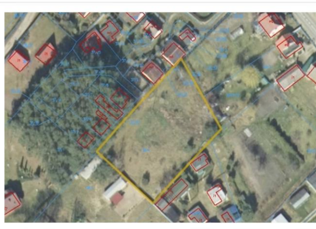
Zdj.2 Ortofotomapa – widok na działkę z góry