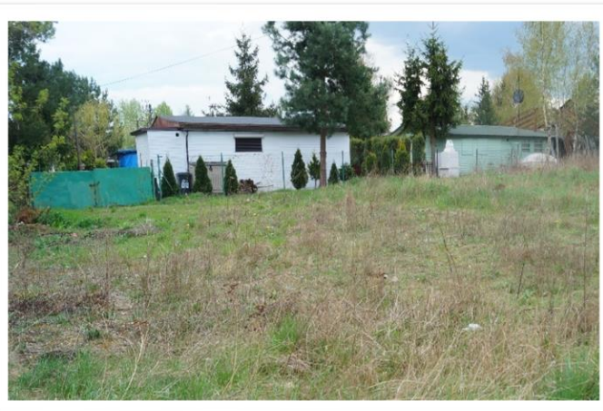
Zdj.1 Widok na działkę

Przetarg odbędzie się w dniu 22 marca 2023 r. o godz. 9 00 w siedzibie Starostwa Powiatowego we Wschowie, Plac Kosynierów 1C, w sali konferencyjnej III p.