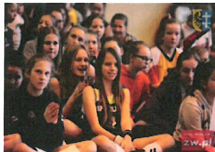
Virtus Volley Cup 12 w Szlichtyngowej

01 grudnia 2015 roku Zarząd Powiatu Wschowskiego podjął uchwałę nr 48/2015 w sprawie ogłoszenia otwartego konkursu ofert na realizację zadań publicznych w 2016 roku oraz zgłaszania kandydatów do Komisji Konkursowej ds. opiniowania ofert organizacji pozarządowych składanych w ramach otwartego konkursu nr OSE.524.1.2015. Przedmiotem konkursu ofert było zlecenie wykonania zadań publicznych w formie wspierania wykonywania zadań publicznych wraz z udzieleniem dotacji na dofinansowanie ich realizacji w następujących dziedzinach z zakresu: