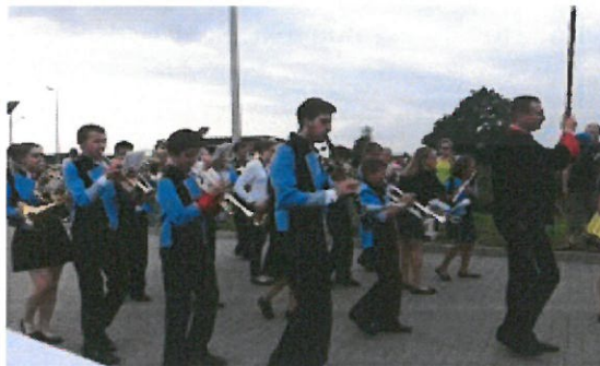
„Z muzyką i tańcem w mieście królewskim”