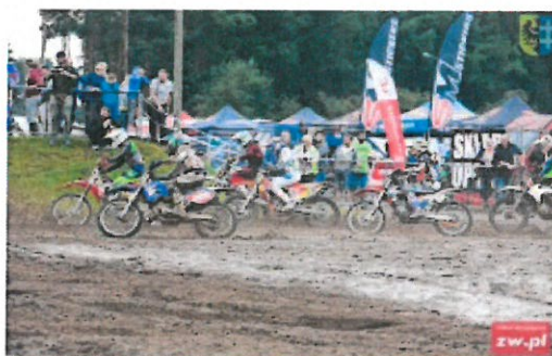
„Mistrzostwa Strefy Polski Zachodniej w Motocrossie”