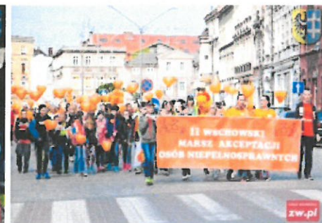
„II Wschowski Marsz Akceptacji”