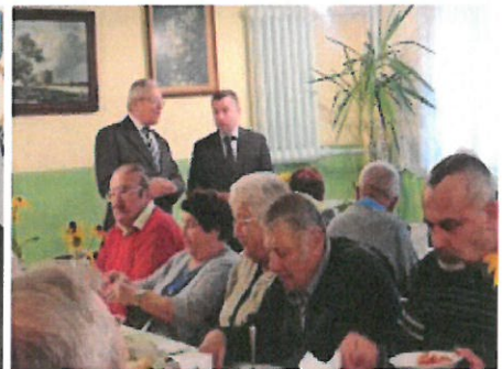
Lubuski Tydzień Seniora