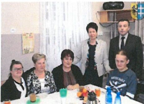
Święto Białej Laski we Wschowie